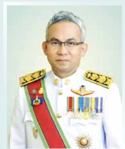
นายอนุกุล ปิตแก้ว ปลัดกระทรวงการพัฒนาสังคม และความมั่นคงของมนุษย์