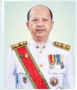
นายอาร์ณู บุญชัย ปลัดกระทรวงการท่องเที่ยวและกีฬา