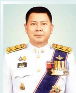
นายประยูร อินสกุล ปลัดกระทรวงเกษตรและสหกรณ์