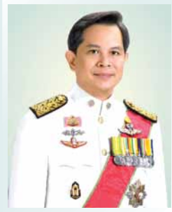
นายพีระพันธุ์ สาสีรัฎฐวิภาค เลขาธิการนายกรัฐมนตรี