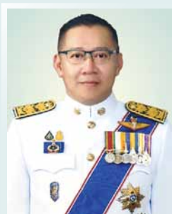
นายชยธรรม์ พรหมศร ปลัดกระทรวงคมนาคม