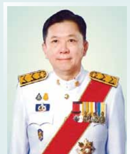
นายจตุพร บุรุษพัฒน์ ปลัดกระทรวงทรัพยากรธรรมชาติและ สิ่งแวดล้อม