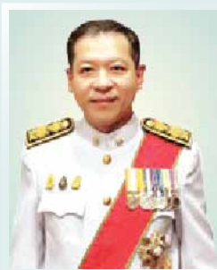
นายศรีณย์ เจริญสุวรรณ ปลัดกระทรวงการต่างประเทศ