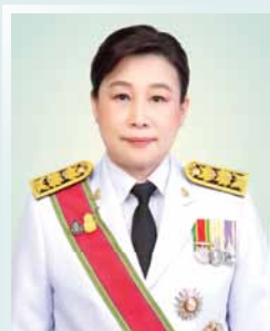
นางยุพา ทวีวัฒนะกิจบวร ปลัดกระทรวงวัฒนธรรม