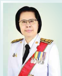
นางสาวอ้อนฟ้า เวชชาชีวะ เลขาธิการ ก.พ.ร.