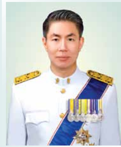
นายณัฐพล รังสิตพล ปลัดกระทรวงอุตสาหกรรม