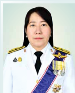
นางพงษ์สวาท กายอรุณสุทธิ์ ปลัดกระทรวงยุติธรรม