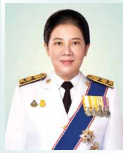
นางณัฐฎฎจารี อนันตศิลป์ เลขาธิการคณะรัฐมนตรี