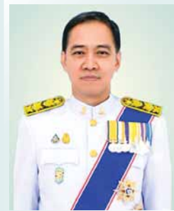
นายเกียรติ รัชโน ปลัดกระทรวงพาณิชย์