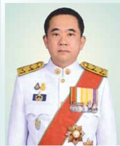
ศาสตราจารย์พิเศษวิศิษฎ์ วิศิษฎ์สรอรรถ ปลัดกระทรวงดิจิทัลเพื่อเศรษฐกิจและสังคม